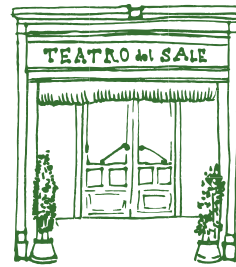
Via dé Macci, 111 r