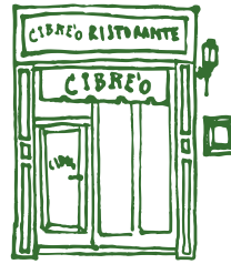
Via A. Del Verrocchio, 8 r