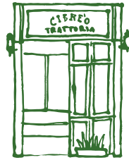
Via dé Macci, 122 r