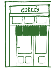
Via A. Del Verrocchio, 2 r